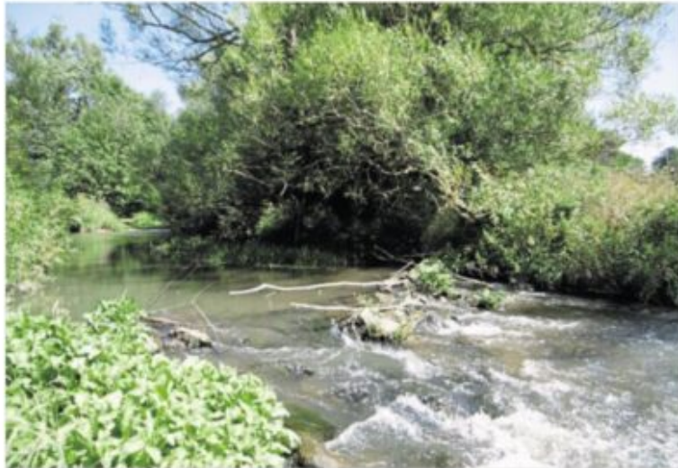
Ein idyllischer Abschnitt der Vils im Norden von Hahnbach.

Lebensader war die Vils aber schon vor mindestens 3000 Jahren, was Funde auf den Anhöhen bezeugen. Als die Zeiten ruhiger wurden und man durch Verbesserungen in der Landwirtschaft effektiver produzieren konnte, begann man mit einer Aufteilung der Gewerbe und wagte sich wohl im 8. Jahrhundert nah an ihre Ufer. Es war zudem jene Zeit, als Missionare erste Christianisierungsversuche machten. Nachgewiesen wurde zum Beispiel, dass der Heilige Wunibald damals einen Wohnsitz und eine Kirche an der Nordfilusa, wohl bei der Ursfarrrei Schlicht hatte. Für die verschiedensten Gewerbe wurde die Vils