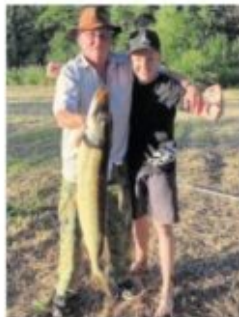
Anglerglück der Fochers am Laubhof.